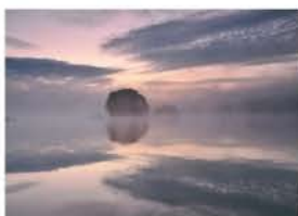
朝焼けの小野川湖