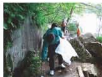
社員による五色沼遊歩道の清掃活動