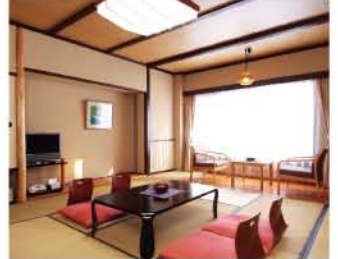
落ち着いた雰囲気のと和室

スイート・洋室・磐梯山側の和室からは、弥六沼越しに磐梯山の噴火口 が見られ、朝夕四季折々に、雄大な裏磐梯高原の風景が楽しめます。