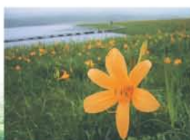
雄国沼のニッコウキスゲ