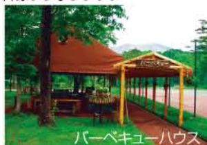
バーベキューハウス